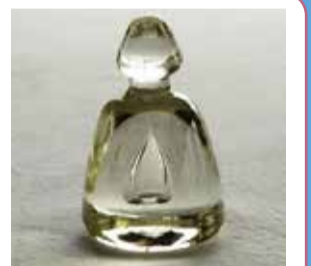
ペーパーウェイト

●販売店 ・Wisewise tools 東京ミッドタウン ・D&DEPARTMENT 渋谷ヒカリエ ・D&DEPARTMENT YAMANASHI YBSビル2階 甲府駅北口