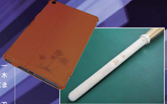
タブレットケース等のレザー製品にオリジナルデザインを

※お問い合わせはメールにてお願いいたします。 nkjsigns@viola.ocn.ne.jp