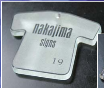
スポーツチームの オリジナルキーホルダー やストラップに