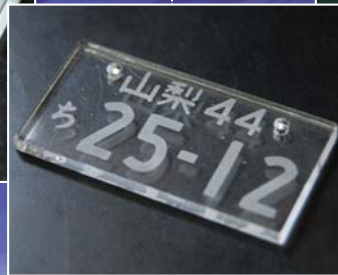
愛車のナンバーと同じ、キーホルダー (ミニナンバープレート)