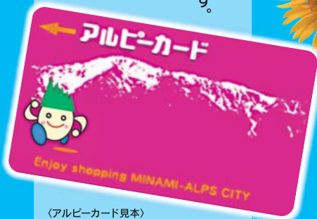
(アルピーカード見本)