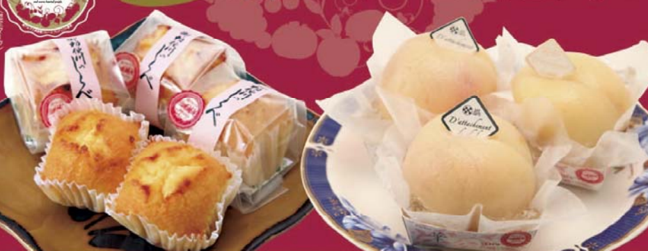
御勅使川のしらべ さくらんぼの甘酸っぱさを包んで、ふんわりと焼き上げた一口サイズのケーキ。 桃娘 (Mamoko) 桃の中心にマスカルポーネームスとベリーソースが桃の味と程良く調和するお菓子。

「南アルプスLOVE」ブランドは、南アルプスを愛する人が南アルプス産の原料でつくるこだわりの土産品・ギフトを、南アルプス桃源郷フルーツプロジェクト実行委員会が、一定の基準により審査し認定するブランドです。現在、ブランド認定商品の応募を受け付けていますので、あなたの事業所の自慢の商品を応募してみませんか。なお、LOVEブランドに認定された商品は、ホームページやマスコミを通じて広くPRさせていただきます。