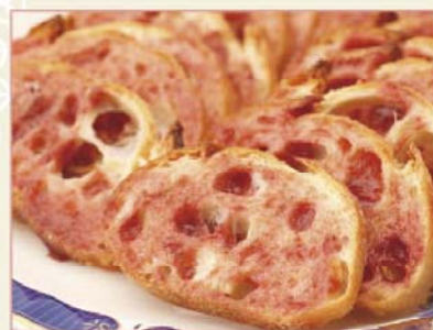
すももの果糖ラスク フランスパンの食感と甘酸っぱいすもも果汁のハーモニーが絶妙なラスク