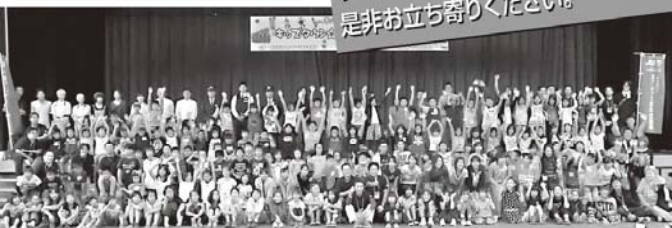
キッズタウン:市内の小中学生を対象とした職業体験事業です。

2月10日、11日「十日市」に ブースを設け活動しておりますので、 是非お立ち寄りください。