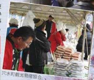
穴水町観光物産協会