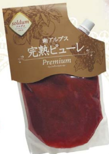
完熟ピューレ・ソルダムプレミアム 完熟フルーツマスターが木で真っ赤に熟すまで育てた最高品だけを原料にした、贅沢なすももピューレ。