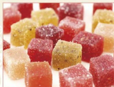
パート・ド・フリュイ 甘酸っぱいすもものピューレをたっぷり使った、爽やかなフルーツゼリー