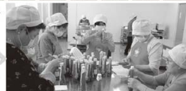
スモモドレッシング製造中!

商工会の会員もしくはその配偶者 ・専従者等で女性の方。 年齢不問! ぜひ、一緒に活動 しましょう。 詳しくは商工会事務局 までお問い合わせください。