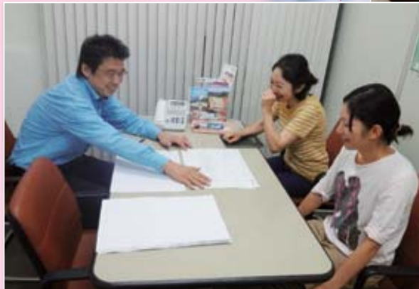
●移転改築に向けて商工会の専門家と打合せが進む