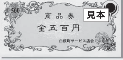
旧白根町サービス店会発行の商品券