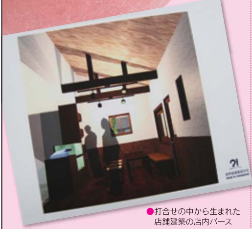
●打合せの中から生まれた店舗建築の店内パース

専門家派遣(正式名称=ネットワーク強化事業)は 商工会員の皆さんが無料で活用できるメリットの1つです。