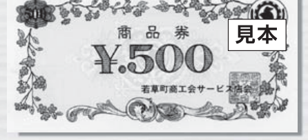
旧若草町商工会サービス店会発行の商品券

お問い合わせ先 南アルプス市サービス店会 南アルプス市飯野2812(南アルプス市商工会内) TEL 055-280-3730