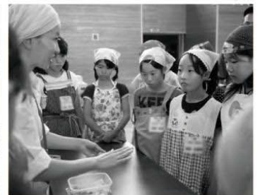
職業体験に入る前に講師より説明があります。子供達も真剣に聞き入っています。