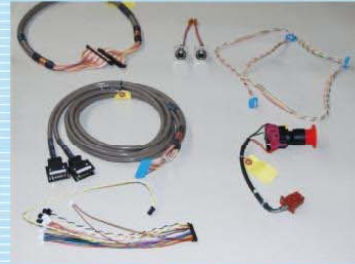
オーフジ電興(株)が製造するハーネス(電気系統配線)

世界的なデフレ経済の中、価格競争・円高・原油高・電気料金の値上げ等で企業を取り巻く経営環境は益々厳しさを増えています。経費の削減・利益増収等に、5S活動を業務改善のツールとし取り組み活用する事業所が増えていきます。