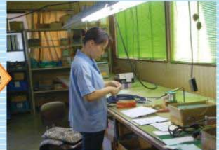
安全性や作業効率から一部立ち作業方式に移行