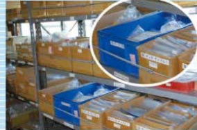
収納箱と棚のアドレス化と地震対策