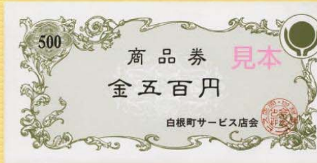
旧白根町サービス店会発行の商品券