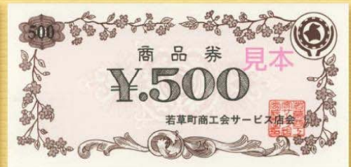
旧若草町商工会サービス店会発行の商品券

お問い合わせ先 南アルプス市サービス店会 南アルプス市飯野2812(南アルプス市商工会内) TEL:055-280-3730