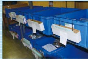
従業員のアイデア提案で採用された納品コンテナBOX