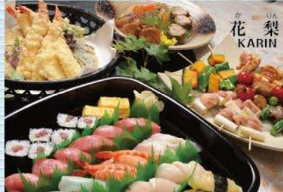
通夜ぶるまいとして、3人盛りベースの豪華な和・洋中4品セットプラン。