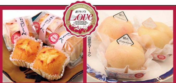
御勅使川のしらべ さくらんぼの甘酸っぱさを包んで、ふんわりと焼き上げた一口サイズのケーキ。