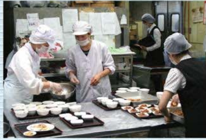
出来立て具材を届ける為に、忙しく働くスタッフの皆さん。