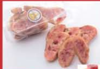
すもも果郷ラスク 色鮮やかなすももピューレを使用し、焼き上げたラスク