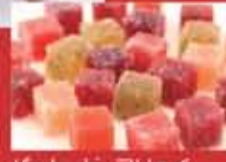
パート・ド・フルーイ