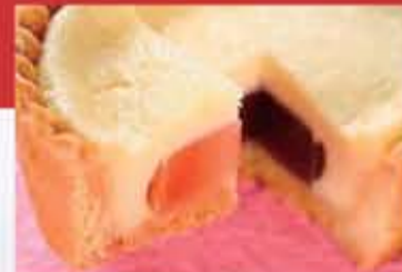
南アルプスすもも便り すももゼリーをクリームチーズで包み、焼いたタルト菓子