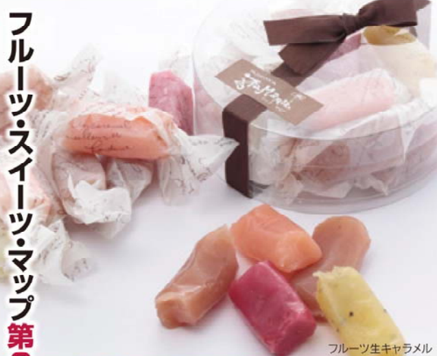
フルーツ生キャラメル