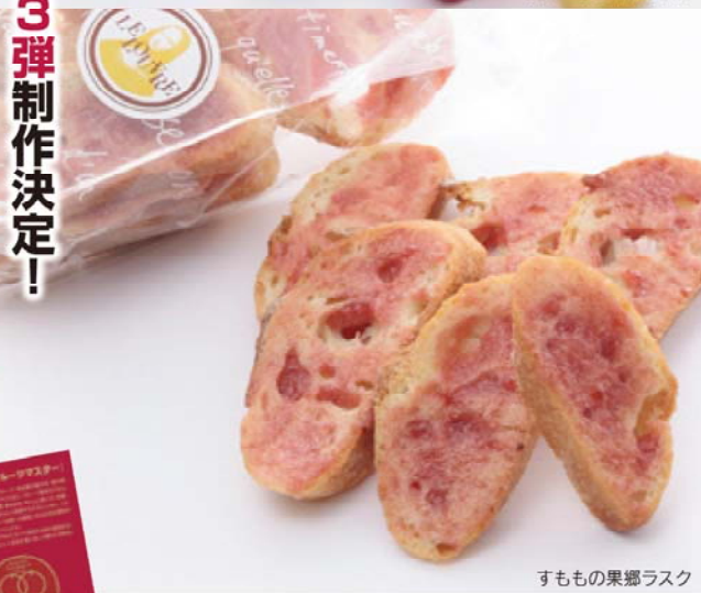
すももの果郷ラスク

◆お問合せ◆ 南アルプス桃源郷フルーツプロジェクト実行委員会 事務局:南アルプス市商工会 〒400-0222 山梨県南アルプス市飯野2812 TEL 055-280-3730 FAX 055-280-3731 E-mail:info@minamialps-shokokai.jp