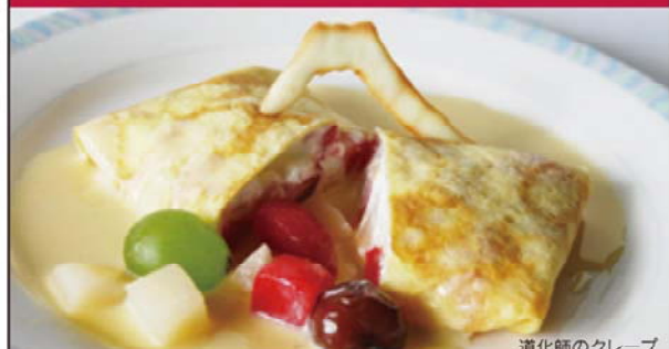
道化師のクレープ

優れた作品は「フルーツ・スイーツ・マップ」に掲載し、観光パンフレットとして市内外に配布しPRいたします。