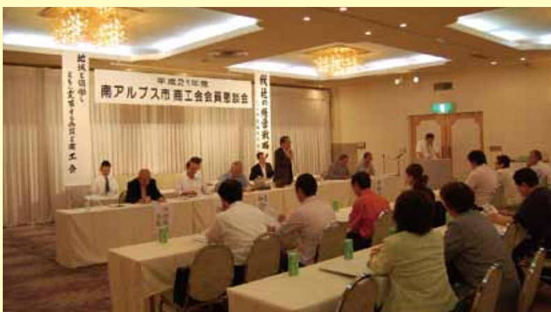
盛大に開催された会員懇談会風景(平成21年度)

南アルプス市商工会は合併8年目を迎え、大規模商工会のメリットを前面に打ち出し、合併効果が具体的に現れる事業を積極的に展開しています。しかしながら、平素会員の皆様と直接意見交換をする機会が少ないので、会員懇談会の場を設定し広く皆様の意見をお伺いし、これからの商工会の活動に反映させていきたいと思っております。積極的な参加をお願いいたします。