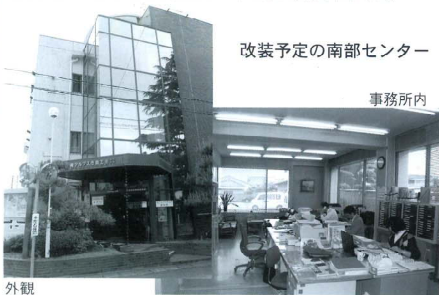
改装予定の南部センター