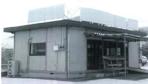
所在地 南アルプス市在家塚992-1

真剣に勉強したい・自己改革をしたい・レベルアップをしたい若手経営者に朗報! 共に学び・共に成長し・共に夢をかなえる