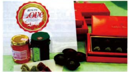
LOVEブランドロゴと認定商品

第一回目の認定商品として「ももの花びらジャム」と「コンフィチュール貴陽」が認定されました。 三月二十七日の発行委員会において、NPO法人南アルプス市が、開花時に農薬を使わない花びらを使用して作った桃の花びらジャムと、2006スイーツGPで最優秀賞を受賞した洋菓子店「シア・マリア」が幻のフルーツと言われる「貴陽」を使ったコンフィチュールの二点が認定を受けました。二十年度から認定商品の公募を行います。