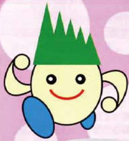
南アルプス市商工会 イメージキャラクター アルピーくん