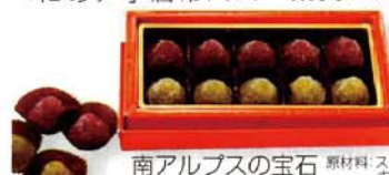
南アルプスの宝石 原材料: 砂糖、卵

南アルプスのおみやげに南アルプスの宝石 南アルプス産の完熟フルーツの美味しさを一年中楽しめるゼリー菓子「南アルプスの宝石」が開発されました。季節の完熟フルーツをビュレにして、 で固めた100%果実の贅沢なお菓子です。今後ハッピーバレー内菓子店、お土産予備品、南アルプス産に最適です。 フルーツプロジェクト事業 農林省・経済産業省 農工商連携88選に選定される 農林省と経済産業省が進める、農林水産業と商工業等の連携により地域経済の発展と振興に寄与した取組み事例「農工商連携88選」に、フルーツプロジェクト事業が選ばれました。