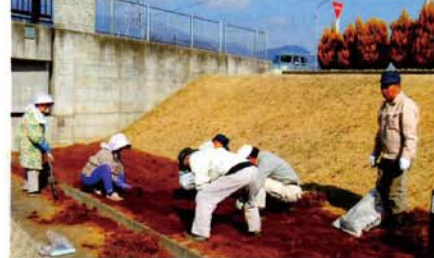
アヤメ花壇の整備

アヤメの開花に向けた作業や祭りの準備など、育てる会のみなさんは今まさに忙しい日々を送っています。そんな活動ができるのも、地域を