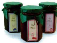
コンフィチュール貴陽

南アルプスのおみやげに南アルプスの宝石 南アルプス産の完熟フルーツの美味しさを一年中楽しめるゼリー菓子「南アルプスの宝石」が開発されました。季節の完熟フルーツをビュレにして、 で固めた100%果実の贅沢なお菓子です。今後ハッピーバレー内菓子店、お土産予備品、南アルプス産に最適です。 フルーツプロジェクト事業 農林省・経済産業省 農工商連携88選に選定される 農林省と経済産業省が進める、農林水産業と商工業等の連携により地域経済の発展と振興に寄与した取組み事例「農工商連携88選」に、フルーツプロジェクト事業が選ばれました。