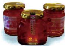
桃の花びらジャム

南アルプスの自然が育んだ「完熟フルーツ」を生かして、南アルプスの魅力を象徴し、発信するブランドです。 南アルプス市産の素材を使って、南アルプスを愛する人が加工した土産品、ギフトを発行委員会が認定し、認定ロゴマークの使用許可と積極的な情報発信を行なっていきます。 将来的には、認定の枠を「サーブिस」や「施設」などにも広げ地域ブランドとして削り上げていきます。