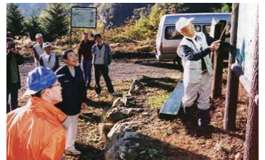
毎年春と秋に開催している芦安山岳館主催の自然観察会では講師を務めている

今年で79歳になりましたが、「達者のうちは、まだまだやるさ」と頼もしい一言。「でも順に引き継いでいかんとならんから、若い人たちとも一緒に活動してるだよ」と後継の育成にも力を入れている様子。さらに「おれんとうのような気持ちの人が、子どもたちの中に1人でも出てくれればうれしいけど、それにはやっぱり自然を知らんきゃだめさ。子どもたちにもっと自然に触れてほしいね」としみじみ。また子どもたちと山や川へ繰り出す日が来るのを楽しみにしています。