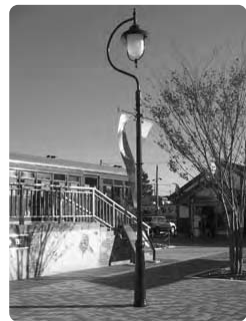
富士急新河口湖駅前照明灯

掲載した事業所につきましては、新規会員の中で希望があった事業所を紹介しています。