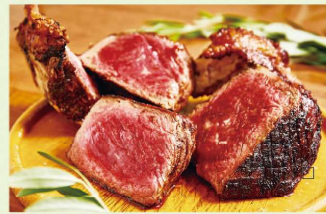
ダチョウ モモ肉(200g) ¥1,660(税込)