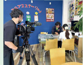
経営課題解決のディスカッション