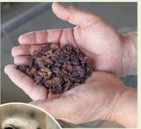
飼料のワインバミス