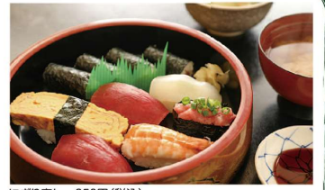
にぎり寿司 950円(税込)

取材日の日替わりランチはとんかつとまぐろのぶつ切りがセットになったもの。サクサクのとんかつとプリプリのまぐろは味もボリュームも大満足のランチです。