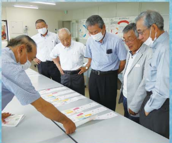
最優秀賞決定の瞬間! 2043首の映える頂点

7月8日(水)に文芸評論家・JA役員・商工会役員による 審査会が行われ、最優秀賞を含む16首が決定しました。 また入選作品は、JA南アルプス市しらね直売所とハッピ ーパークで展示を予定しております。