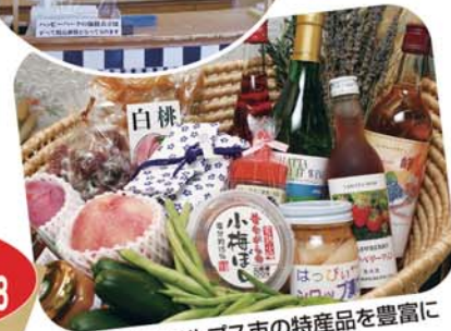
店内には南アルプス市の特産品を豊富に 取り揃えてお待ちしております。