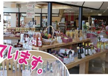
新型コロナ対策も 行っています。