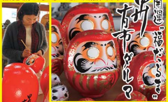
若草瓦会館前にて販売