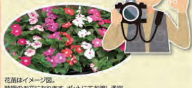
花苗はイメージ図。時期のお花になります。ポットにてお渡し予定。