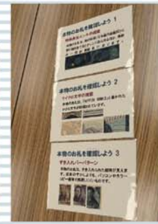
紙幣の偽造防止技術