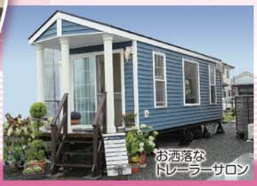
お洒落なトレーラーサロン