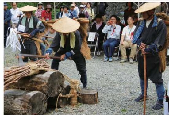
山の案内人が藁で組上げた門を斧で切り開き登山家達の無事を見送る