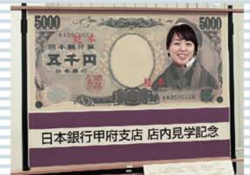
樋口一葉になれる!