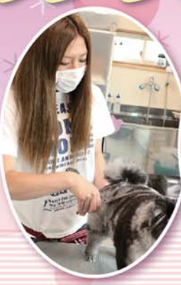
カット中のオーナー

サロンはブルーのトレーラーハウスでとってもおしゃれ♪愛犬のソラちゃんとマメちゃんが可愛く迎えてくれます。オーナーおすすめメニューは、ハーブパック。オーガニック100%使用で、もしワンちゃんが食べてしまっても大丈夫！ハーブは虫よけの効果があり、今の季節にはぴったりです。