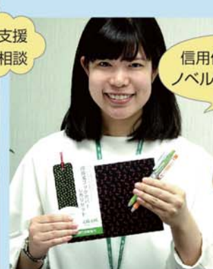
信用保証協会のノベルティーグッズ