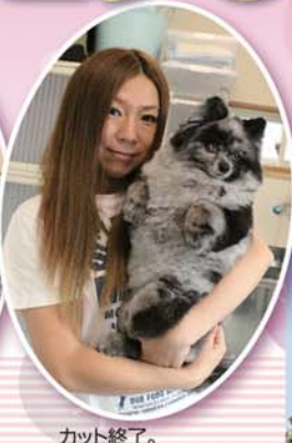
カット終了。ソラちゃん「ハイポーズ」!