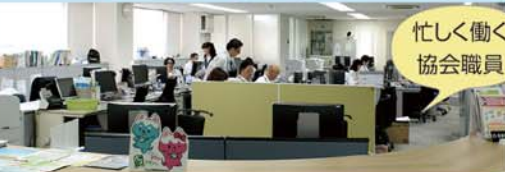
忙しく働く協会職員