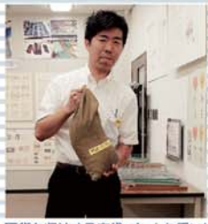
硬貨を収納する麻袋。ずっしり重い!