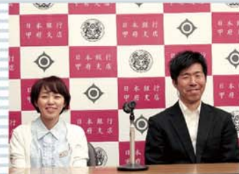
記者会見の雰囲気!