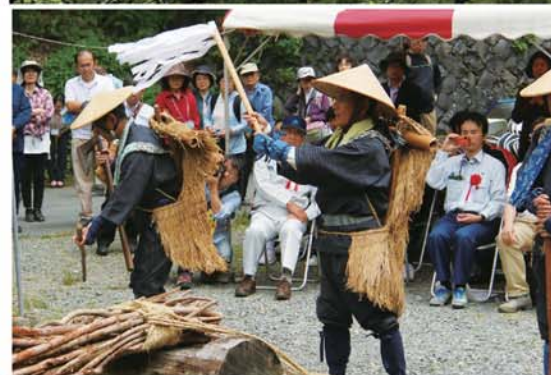
地元代表の方々が明治時代の山の案内人に扮し安全祈願のお誂えを行う