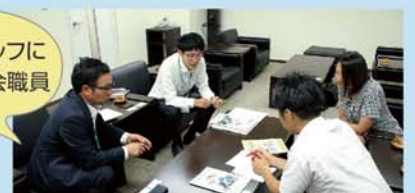
商工会スタッフに説明する協会職員