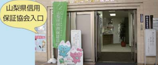
山梨県信用保証協会入口

昭和24年5月28日、「山梨県信用保証協会」は設立し、来年5月に協会創立70周年を迎えます。より身近に感じて頂けるよう、イメージキャラクターを作成しました。富士山と甲斐犬をもとに生まれた「シンくん」と「ヨウちゃん」。協会のロゴから生まれた「タモツさん」。力を合わせてみんなの活動をサポートします。