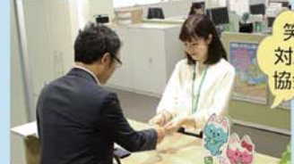
笑顔で対応する協会職員