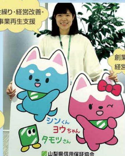
山梨県信用保証協会