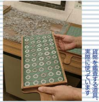
貨幣を鑑査する道具、実際に使っています

日本銀行甲府支店総務課 広報担当 住所 〒400-0032 甲府市中央1-11-31 お申込み先 TEL:055-227-2419 FAX:055-220-1073 E-mail:kofu@boj.or.jp URL: http://www3.boj.or.jp/kofu/ ★一般見学も随時受付中!