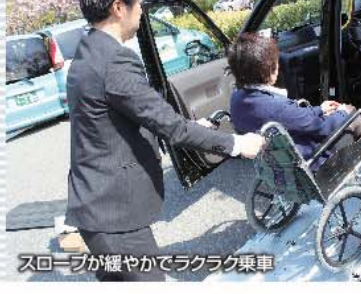
スロープが緩やかでラクラク乗車