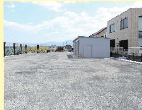
50台収容可能な駐車場