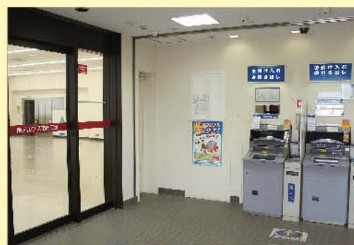
ATMコーナーも併設した玄関ロビー