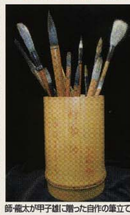
師・龍太が甲子雄に贈った自作の筆立て