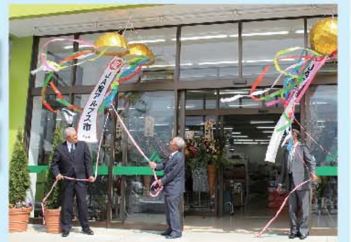
くす玉を割りオープニングセレモニー

〒400-0414 南アルプス市戸田45 (Aコープ甲西店となり) TEL:055-284-6186 FAX:055-284-3322 営業時間:(4月~9月) 8:00-19:00 (10月~3月) 8:30-19:00 定休日:年末年始 棚卸日