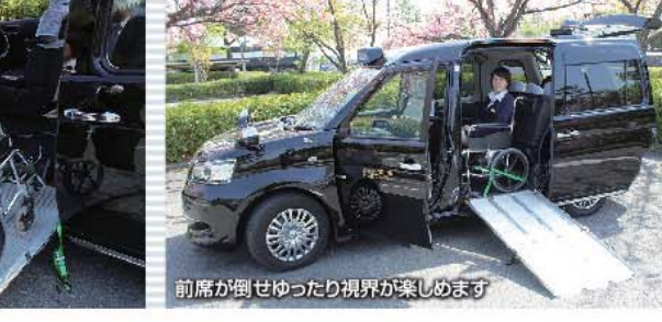
前席が倒せゆったり視界が楽しめます