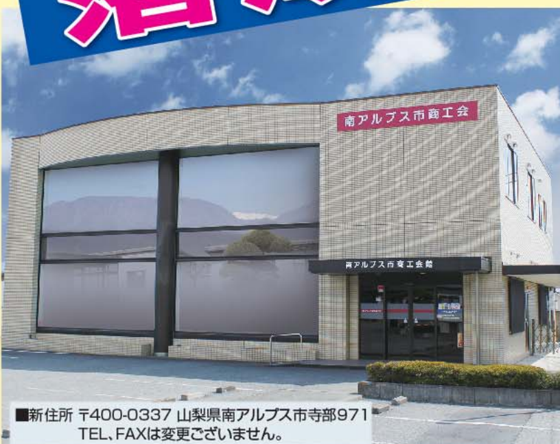
■新住所 〒400-0337 山梨県南アルプス市寺部971 TEL、FAXは変更ございません。