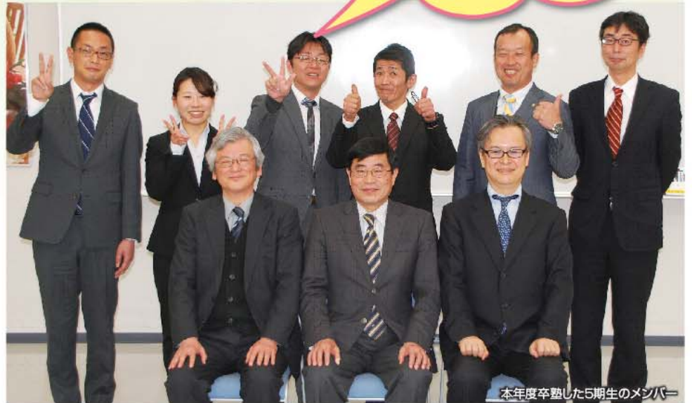
本年度卒業した5期生のメンバー