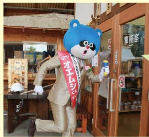
木の国サイトさんにお邪魔します。