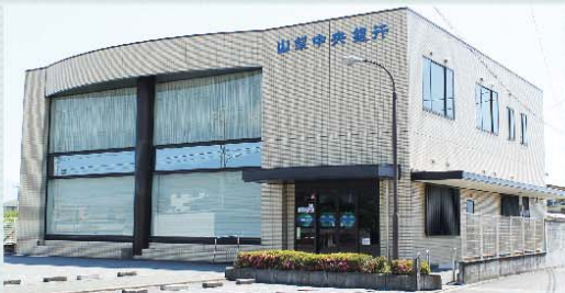
移転先として正式に取得した山梨中央銀行若草支店