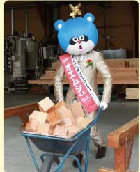
オエムシくん 一輪車に挑戦!

「good wood , good life」 …地産を大切に、お客様へ安全で豊かな暮らしをお約束しながら、「～癒しの空間と安らぎをお届け～」する想いの元、南アルプス市内で活躍されている企業です!!