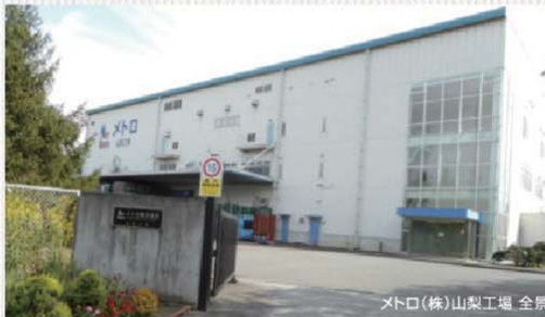
メトロ(株)山梨工場 全景

メトロ株式会社は、昭和24年に飲料メーカーとして東京都武蔵野市で創業。平成12年に南アルプス山麓の清らかで良質な伏流水が利用できる好環境地である南アルプス市へ工場を移転しました。 創業以来、高品質と新鮮にこだわった商品開発に取り組み、中でも主力商品のリキッドコーヒーやリキッドティ、フルーツジュースは、全国のコーヒー専門店や有名喫茶チェーン、一流ホテルレストランで高い評価を得ています。また、山梨県産の桃100%の桃ジュースを商品化するなど、山梨ならではの商品づくりも行っています。 なお、当工場では小ロット多品種生産にも対応しており、2千以上でオリジナルジュースを製造していただけるそうです。