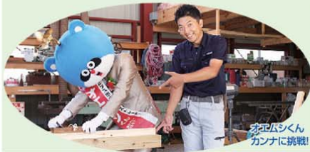
オエムシくんカンナに挑戦!

南小林建築所では「笑顔で永いお付き合いが出来る建築所」を目指し日々心を込めて対応しています。