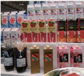
製品ラインナップ