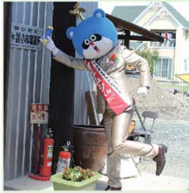
(有)小林建築所さんにお邪魔します。