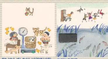
おたより(しぜんのに) 1978年12月