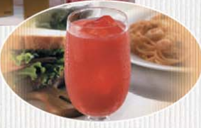
トロピカルドリンク