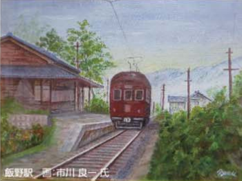
飯野駅 画:市川良一氏