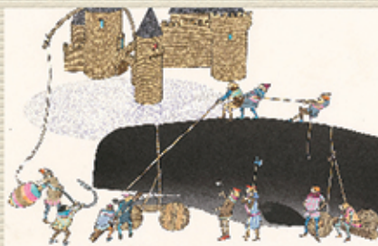
おおきなもののすきなおうさま

安野光雅は、最も人気の高い絵本作家の一人です。1926年に島根県津和野町に生まれ、1968年に文章のない絵本「ふしぎなえ」で絵本界に鮮烈にデビューしました。今展では、幼児向けの雑誌「しぜんのくに」の表紙を飾った「おたより」や、「おおきなもののすきなおうさま」のほか、最新作である「わたしの好きな子どものうた」の原画など約80点を展示し、楽しく魅力にあふれた安野光雅の芸術世界を紹介します。