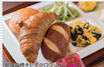
朝食の焼きたてクロワッサン

香りとサクサク感がたまらない焼きたてパン! 有機大豆・有機米を使用した身体にやさしい「こだわりのお味噌汁」&有機JAS納豆 オレンジジュース・ウーロン茶・炭酸飲料・コーヒーなど