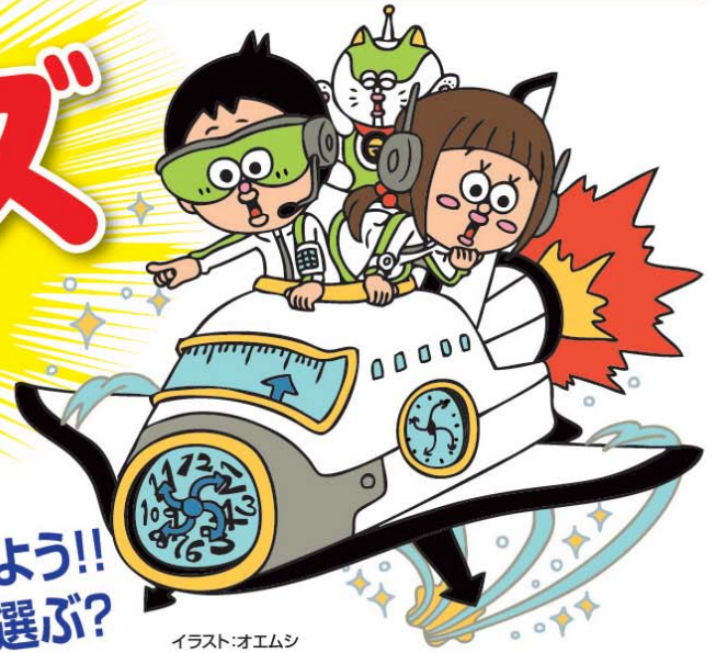
イラスト:オエムシ

10.21 SAT ●受付時間:12:00~12:20 ●開始時間:12:30~ ●終了時間:17:30 雨天決行 今日南アルプス市のいろいろなお仕事に挑戦だよ! 希望のコースを選んで、2つのお仕事を体験してみよう。 ワクワク、ドキドキのキッズタウンの始まりだよ。