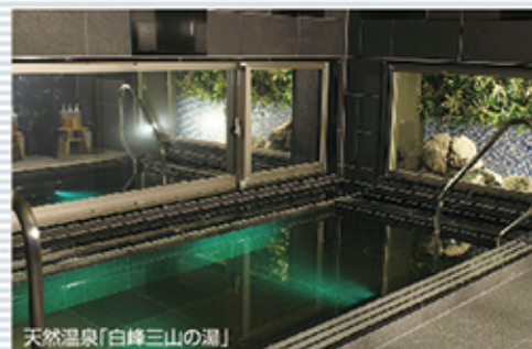
天然温泉「白峰三山の湯」

【源泉】今諏訪温泉御柱の湯 【泉質】ナトリウム・炭酸水素塩温泉 【効能】神経痛・筋肉痛・関節痛・五十肩など 入浴時間 15:00～翌朝9:30