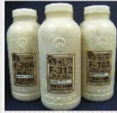
原木シイタケ種菌