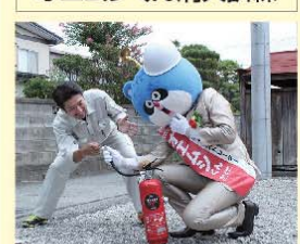
オエムシくん消火活動中~上手く消せるかな?(汗) 無事に消火成功!!