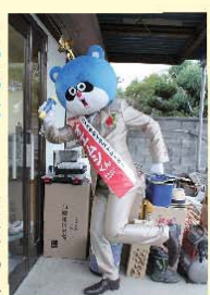
落合防災(株)にお邪魔します。

ヌイグル民族出身で南アルプス市を拠点として活躍している人気のイラストレーター。「ゆるキャラ」ランプリにもエントリー中であり、子どもからお年寄りまで幅広い層から愛されています。「地元を元気に盛り上げるムシ」