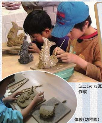
ミニしゃち瓦作成