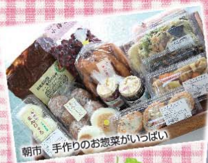
朝市・手作りのお惣菜がいっぱい