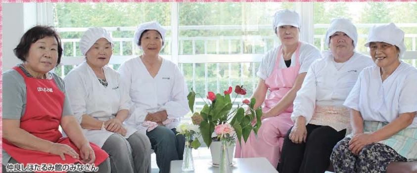
仲良しほたるみ館のみなさん

※フルーツピューレとは 果物の果肉をとるみのある滑らかな半液状にしたもので、ヨーグルト、アイスクリーム等様々なフルーツソースとしてご利用いただけます。