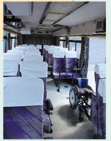
車椅子設置後の広々とした車内

人が集うところにコトブキがある 株式会社甲府コトブキ 株式会社甲府コトブキは、昭和63年、劇場やホール、スタジアム学校、議場などに、設置されるイスや机の開発製造を行なうコトブキキーンティング株式会社の関連会社として南アルプス市に誕生しました。人が集うところにコトブキのイスがあると言われるほど、全国1,000箇所以上の公共施設等に納入実績があります。甲府工場では、従業員35名が「人に優しく、安全で快適なイス」づくりに邁進しています。 また同社は、1979年大阪に誕生した世界初のカプセルホテルにカプセルベッドを納入して以来、6,000床の納入実績を持ち、国内シェアの9割を占めています。今、2020年の東京オリンピックに向けて大忙しです。なお、その技術力は国内だけでなく海外でも認められ、国内外の多くの宿泊施設で採用されています。