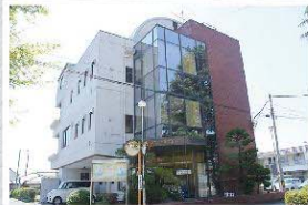
6月30日で閉所した南部センター(旧櫛形町商工会館)