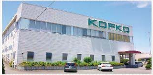
株甲府コトブキ工場外観

特集工場潜入レポート 第14弾 市内には大きな工場がたくさんあります。でも、何を作っているの?どんな会社なの?という声をよく聞きます。そんな声にお応えして、南アルプス市工業団地連絡協議会の会員企業の工場に突撃レポートしていきます。