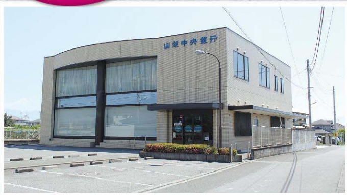
移転先として決定した旧山梨中央銀行若草支店