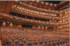
兵庫県立芸術文化センター納入事例

【会社概要】 会社名: 株式会社甲府コトブキ 住所: 山梨県南アルプス市下高砂1077-1 電話番号: 055-285-3321 事業内容: ホール・劇場用連結椅子、スタジアム、競技場・体育館・アリーナ用観覧席、教育施設用机・椅子、宿泊・仮眠用カプセルベッドなどの製造