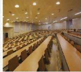
名古屋工業大学納入事例