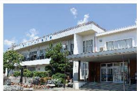
解体予定の北部センター(旧白根町商工会館)