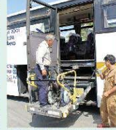
ボタン操作でラクラク乗降