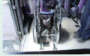
車内にフック等で完備設置