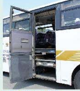
車両左側にリフト設備